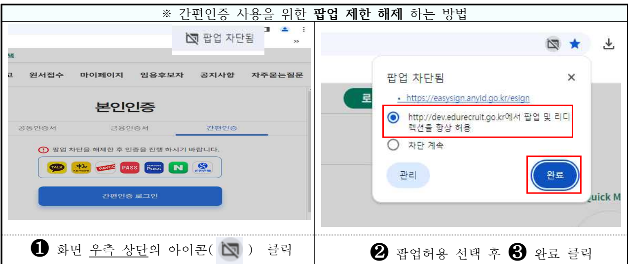
① 화면 우측 상단의 아이콘( ) 클릭