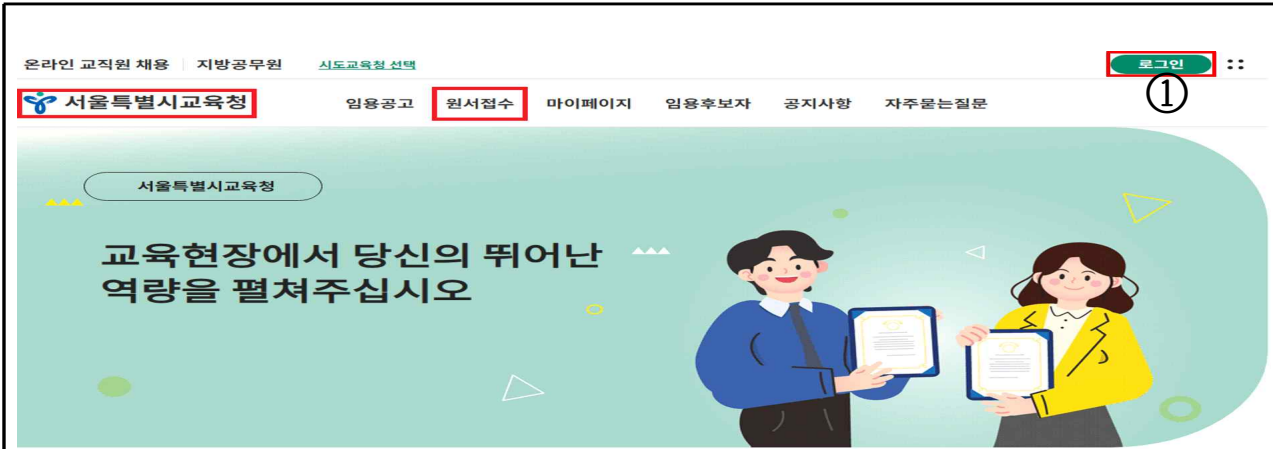
① 화면 우측 상단 [로그인] 클릭