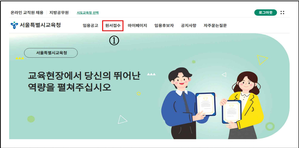
① [원서접수] 버튼 클릭